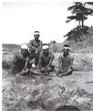
大正13年8月6日浦富にて