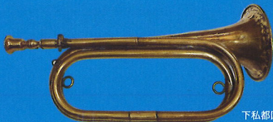
下私都国民学校旧蔵ラッパ