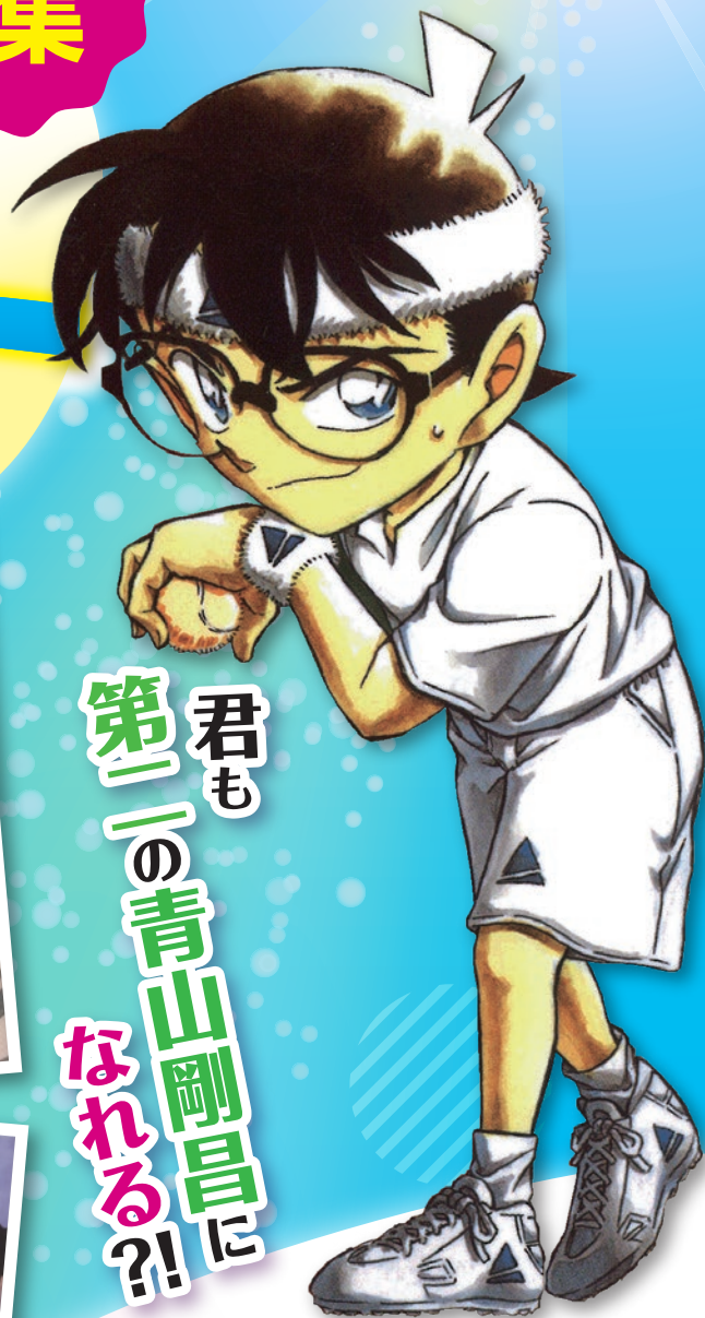
イラスト コンテスト