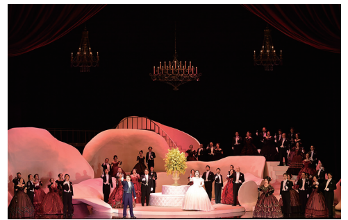
2023年7月東京公演より